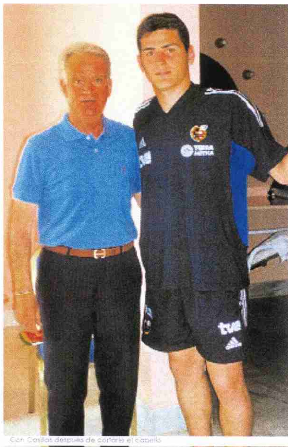
Cón Casillas después de cortarle el cabello

motivos en el mundo de la moda. Por eso, es lógico que los futbolistas cuiden mucho su imagen personal y capilar. Pero es que, además, a estos nuevos "héroos" de la imagen les encanta mostrar al mundo su rebeldía capilar, con ciertos colores de cabello cuidadosamente estudiados, con volúmenes dinámicos, desenfadados, cómodos y muy estructurados, algunos de ellos con cierto glamour. De esta manera, consiguen ser auténticos ídolos para la juventud, que los emula e imita, y son muy conscientes de la responsabilidad que tienen en este sentido. Les encantan las "marcas" porque pueden y tienen toda la información, pues viajan mucho, y ya se sabe que viajar es cultura. Ello hace que jamás se olviden de su figura, su personalidad, su indumentaria y su aspecto físico en general, teniendo en cuenta, además que todo ello debe concordar de manera armónica para suscitar la atracción estética de los demás. Santi Cañizares es nuestro mejor ejemplo de líder alfusor, llevando ese espectacular color que su futbolista logra, singularizando tanto a este gran portero. Otro ejemplo clarísimo es David Beckham, que con sus constantes cambios de aspecto en estos momentos es, sin duda, la estrella apolínea galáctica.