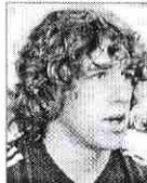
□ Carles Puyol

«IPI. Defensa y ataque, juventud y madurez, fuerza y pundonor suman un total futbolista. Rebelde en su cuidado capilar, se aburre de verse siempre igual y cambia».