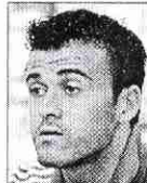
□ Luis Enrique

«Destaca su inteligencia, elegancia y generosidad futbolística. Un IPI destacado dentro del mundo del deporte. Sabe innovar».